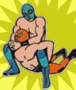
LA DE A CABALLO

Debe su nombre a la tierra natal de su creador, Rito Romero. Hay que colocarse detrás del rival y anclar sus piernas con los pies. Tras sujetar sus brazos con las manos, se inclina el cuerpo propio hacia atrás y se eleva al adversario.